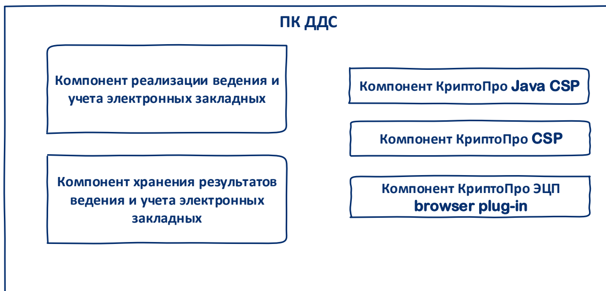
Рисунок 1 – Компонентная структура ПК ДДС.

Для функционирования ПК ДДС необходимо совместное применение СКЗИ Мастерчейн.